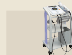
超音波治療器 承認番号：224AABZX00053000

高齢者の転倒事故を防ぎ、介護不要の自立した生活をサポートするために、身体機能の向上が求められています。「ウェルトニックシリーズ」は、そうした社会的要請に応じて設計・開発された高齢者のためのトレーニングマシン。CGT(包括的高齢者運動トレーニング)に必要とされる多様な機種をそろえています。