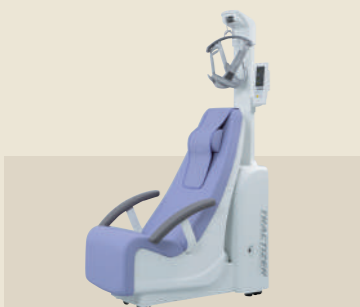
電動型自動牽引装置 承認番号：226AABZX00076000

超音波の機械的振動を生体に与え、その温熱作用とマイクロマッサージ作用による疼痛緩和や血流促進を目的とした超音波治療器です。通常、超音波治療では1MHzと3MHzの2種類の周波数を使用しますが、SZ-100は1台で両方の治療が可能です。