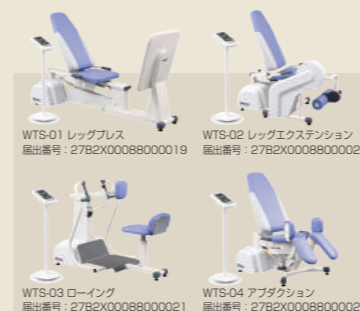
WTS-01 レッグプレス 届出番号：27B2X00088000019 WTS-02 レッグエクステンション 届出番号：27B2X00088000020 WTS-03 ローイング 届出番号：27B2X00088000021 WTS-04 アブダクション 届出番号：27B2X00088000022 測定機能付自力運動訓練装置

ワイドレンジの低周波治療器ポラリスカインが、軽量設計のスリムフィット導子の装備と、遠隔操作を実現するスタンドリモコン(オプション)のラインナップで、さらに使い易くなった登場。8チャンネルを効率的に稼働します。