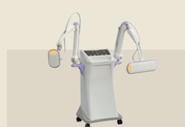
マイクロ波治療器 承認番号：225AABZX00081000

1台で腰椎牽引も頸椎牽引も行える2wayタイプの自動間欠牽引装置「スーパートラックST-3CL」。ミナト医科学が培った頸椎牽引の技術をスーパートラックに統合。座ったままのリラックスした姿勢で、治療部位に適した牽引角度が設定できます。