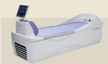
ベッド型マッサージ器 承認番号：229AABZX00048000