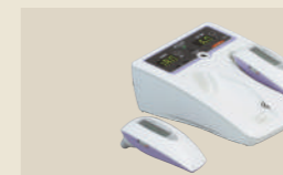
半導体レーザー治療器 承認番号：223008ZX00158000

マイクロタイザー MT-5の、自在に可動するフリーアームと、新発想の接触型アプリケーション。これにより、簡単操作であらゆる治療部位へ柔軟にフィットするとともに、不要放射の低減による優れたエネルギー効率を実現。新しい治療スタイルを提案します。