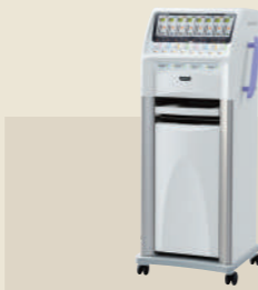
低周波治療器 承認番号：224AIBZX00062000

筋肉の柔軟性を向上させ、より効率的な治療を目指したメディカルモードを搭載。加えて、6つのノズルが強くやさしい刺激を生み出し、快適さを実現するマッサージマシンへと進化した。進化したリラクゼーションの実現と治療感がここにあります。