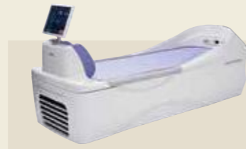
ベッド型マッサージ器 承認番号：229AABZX00048000

半導体レーザーの照射によって、筋肉や関節の痛みをやわらげるレーザー治療器。パワー密度が高い180mWの最高出力をピンポイントで照射し、素早く「痛み」の深部に浸透。腰痛、肩こり、関節炎やリウマチ、あるいはスポーツによる筋肉痛、腱鞘炎に効果を発揮します。優れた可搬性で、「いつでも、どこへでも」半導体レーザー治療を提供します。