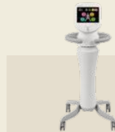
低周波治療器 承認番号：227AIBZX00003000

ブーツ内部の片側5つの気室を加圧・除圧することで脚部をマッサージ。4種類のマッサージモードで症状に合わせた治療を行います。必要な時、必要な場所へ自由に移動できる優れた搬送性は、新しい治療スタイルを提案します。