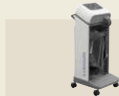
家庭用エアマッサージ器 承認番号：225AHBZX00021000

超音波の機械的振動を生体に加え、その温熱作用とマイクロマッサージ作用による疼痛緩和や血流促進を目的とした超音波治療器です。通常、超音波治療では1MHzと3MHzの2種類の周波数を使用しますが、SZ-100は1台で両方の治療が可能です。