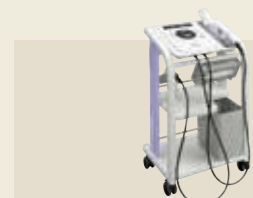
超音波治療器 承認番号：224AABZX00053000