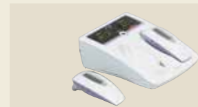
半導体レーザー治療器 承認番号：22300BZX00158000