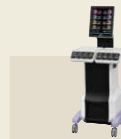
低周波治療器・干涉電流型低周波治療器組合せ理学療法機器 承認番号：231AABZX00011000

少ない電流で大きな筋収縮が得られ、高齢者や慢性心不全の患者様でも筋疲労をきたしにくい低周波治療が行えます。通電による痛みや不快感を軽減しているため、長時間の治療が可能となりました。