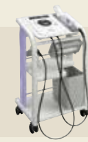
超音波治療器 承認番号：224AABZX00053000