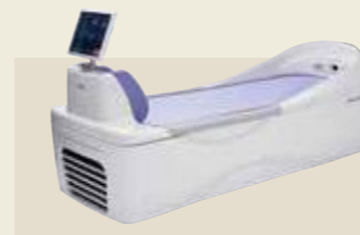
ベッド型マッサージ器 承認番号：229AABZX00048000

1台で腰椎牽引も頸椎牽引も行える2wayタイプの自動間欠牽引装置「スーパートラック ST-3CL」。ミナト医科学が培った頸椎牽引の技術をスーパートラックに統合。座ったままのリラックスした姿勢で、治療部位に適した牽引角度が設定できます。