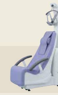
電動型自動間欠牽引装置 承認番号：226AABZX00076000

少ない電流で大きな筋収縮が得られ、高齢者や慢性心不全の患者様でも筋疲労をきたしにくい低周波治療が行えます。通電による痛みや不快感を低減しているため、長時間の治療が可能となりました。