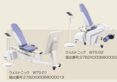
ウェルトニック WTS-01 届出番号：27B2X00088000019

超音波の機械的振動を生体に加え、その温熱作用とマイクロマッサージ作用による疼痛緩和や血流促進、組織の修復等を目的とした超音波治療器です。通常、超音波治療では1MHzと3MHzの2種類の周波数を使用しますが、SZ-100は1台で両方の治療が可能です。