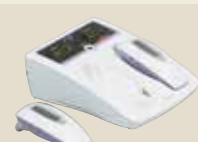
半導体レーザー治療器 承認番号：22300BZX00158000