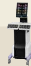
低周波治療器・干渉電流型低周波治療器組合せ理学療法機器 承認番号：231AABZX00011000

筋肉の柔軟性を向上させ、より効率的な治療を目指したメディカルモードを搭載。加えて、6つのノズルが強くやさしい刺激を生み出し、快適さを実現するマッサージマシンへと進化しました。