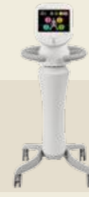
低周波治療器 承認番号：227AIBZX00003000

高齢者の転倒事故を防ぎ、介護不要の自立した生活をサポートするために、身体機能の向上が求められています。「ウェルトニックシリーズ」は、そうした社会的要請に応じて設計・開発された高齢者のためのトレーニングマシン。CGT(包括的高齢者運動トレーニング)に必要とされる多様な機種をそろえています。