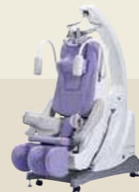
電動型自動間欠牽引装置 ST-3 承認番号：229AABZX00066000

半導体レーザーの照射によって、筋肉や関節の痛みをやわらげるレーザー治療器。パワー密度が高い180mWの最高出力をピンポイントで照射し、素早く「痛み」の深部に浸透。優れた可搬性で、「いつでも、どこでも」半導体レーザー治療を提供します。