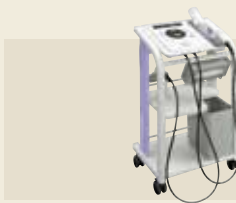
超音波治療器 認証番号：224AABZX00053000