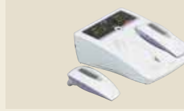
半導体レーザー治療器 承認番号：223008ZX00158000

超音波の機械的振動を生体に加え、その温熱作用とマイクロマッサージ作用による疼痛緩和や血流促進を目的とした超音波治療器です。通常、超音波治療では1MHzと3MHzの2種類の周波数を使用しますが、SZ-100は1台で両方の治療が可能です。