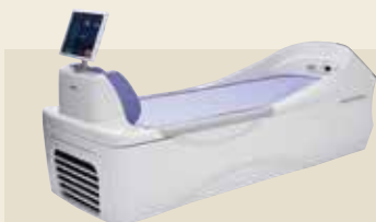
ベッド型マッサージ器 認証番号：229AABZX00048000