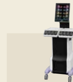
低周波治療器・干渉電流型低周波治療器組合せ理学療法機器 認証番号：231AABZX00011000

下肢からの刺激により、三次元的な脊柱の動きを誘発し、体幹のみならず上下肢関節周囲の筋緊張を連続的に軽減させます。