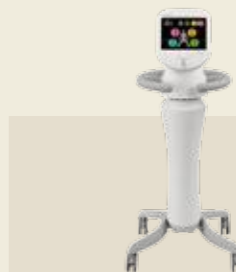
低周波治療器 認証番号：227AIBZX00003000