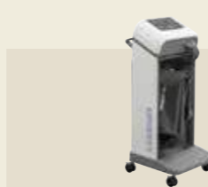
家庭用エアマッサージ器 認証番号：225AHBZX00021000

筋肉の柔軟性を向上させ、より効率的な治療を目指したメディカルモードを搭載。加えて、6つのノズルが強くやさしい刺激を生み出し、快適さを実現するマッサージマシンへと進化しました。