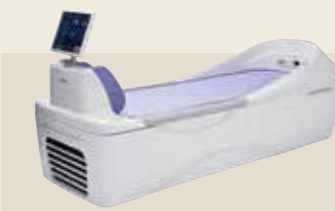
ベッド型マッサージ器 認証番号：229AABZX00048000