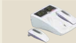
半導体レーザー治療器 承認番号：223008ZX00158000

超音波の機械的振動を生体に加え、その温熱作用とマイクロマッサージ作用による疼痛緩和や血流促進を目的とした超音波治療器です。通常、超音波治療では1MHzと3MHzの2種類の周波数を使用しますが、SZ-100は1台で両方の治療が可能です。