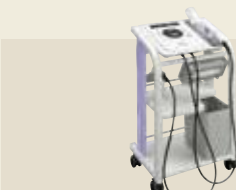
超音波治療器 認証番号：224AABZX00053000

少ない電流で大きな筋収縮が得られ、高齢者や慢性心不全の患者様でも筋疲労をきたしにくい低周波治療が行えます。通電による痛みや不快感を低減しているため、長時間の治療が可能となりました。