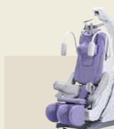
電動型自動間欠牽引装置 ST-3 認証番号：229AABZX00066000

下肢筋全般の筋肉を強化し、立ち上がる、座る、しゃがむ、歩く等の動作、日常生活に必要な筋力を強化します。足を固定しシートが可動する構造により、実際の動作により近い運動が行えます。