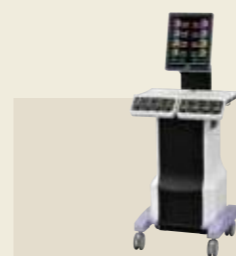
低周波治療器・干渉電流型低周波治療器組合せ理学療法機器 認証番号：231AABZX00011000

ブーツ内部の片側5つの気室を加圧・除圧することで脚部をマッサージ。4種類のマッサージモードで症状に合わせた治療を行います。必要な時、必要な場所へ自由に移動できる優れた搬送性は、新しい治療スタイルを提案します。