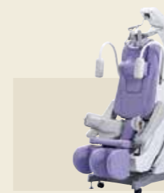
電動型自動間欠牽引装置 ST-3 認証番号：229AABZX00066000

高齢になると、膝関節の可動域が狭くなる場合があります。運動することで歩幅が広がり、膝が安定し、階段の上り下りもスムーズになります。 ●筋力測定の結果をWBIで表示することができます。