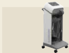
家庭用エアマッサージ器 認証番号：225AHBZX00021000

筋肉の柔軟性を向上させ、より効率的な治療を目指したメディカルモードを搭載。加えて、6つのノズルが強くやさしい刺激を生み出し、快適さを実現するマッサージマシンへと進化しました。進化したリラクゼーションの実現と治療感がここにあります。