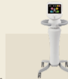
低周波治療器 認証番号：227AIBZX00003000