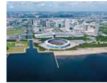
ZOZO マリンスタジアム (千葉県)

※ショールーム担当スタッフのマスク着用や展示機器のアルコール消毒、十分な空気換気等の感染予防対策を徹底してお待ちしております。