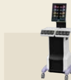
低周波治療器、干渉電流型低周波治療器組合せ理学療法機器 認証番号：231AABZX00011000

ブーツ内部の片側5つの気室を加圧・除圧することで脚部をマッサージ。4種類のマッサージモードで症状に合わせた治療を行います。必要な時、必要な場所へ自由に移動できる優れた搬送性は、新しい治療スタイルを提案します。