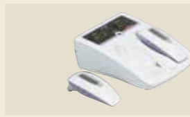
半導体レーザー治療器 承認番号：22300BZX00158000

超音波の機械的振動を生体に加え、その温熱作用とマイクロマッサージ作用による疼痛緩和や血流促進を目的とした超音波治療器です。通常、超音波治療では1MHzと3MHzの2種類の周波数を使用しますが、SZ-100は1台で両方の治療が可能です。