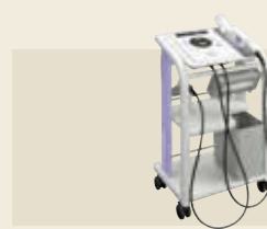
超音波治療器 認証番号：224AABZX00053000

少ない電流で大きな筋収縮が得られ、高齢者や慢性心不全の患者様でも筋疲労をきたしにくい低周波治療が行えます。通電による痛みや不快感を低減しているため、長時間の治療が可能となりました。