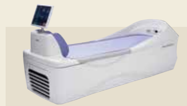
ベッド型マッサージ器 認証番号：229AABZX00048000