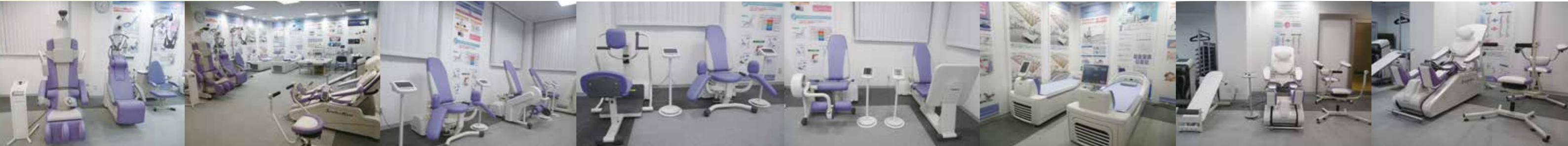
営業所ショールーム例