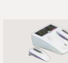
半導体レーザー治療器 承認番号：22300BZX00158000

温熱治療に心地よいリズムで治療感を向上させた乾式ホットバック装置ホットリズム。院内に自由に設置できる自立型筐体と、柔軟性と装着性を大きく向上させたホットバックがスムーズな治療への導入と心地よい治療を実現します。