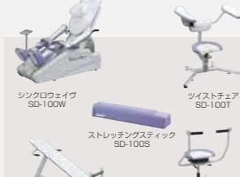
シンクローエイジ SD-100W ツイストチェア SD-100T ストレッチングスティック SD-100S ストレッチングベンチ SD-100B フレックスチェア SD-100F

高齢者の転倒事故を防ぎ、介護不要の自立した生活をサポートするために、身体機能の向上が求められています。「ウェルトニックシリーズ」は、そうした社会的要請に応じて設計開発された高齢者のためのトレーニングマシン。CGT(包括的高齢者運動トレーニング)に必要なとされる多様な機種をそろえています。