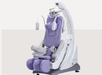
電動型自動牽引装置 ST-3 認証番号：229AABZX00068000