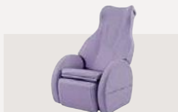
電位治療器 認証番号：301AABZX00016000

1台で腰椎牽引も頸椎牽引も行える2wayタイプの自動牽引装置「スーパートラック ST-3CL」。ミナト医科学が培った頸椎牽引の技術をスーパートラックに統合。座ったままのリラックスした姿勢で、治療部位に適した牽引角度が設定できます。