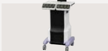
低周波治療器・干渉電流型低周波治療器組合せ理学療法機器 認証番号：231AABZX00011000

筋肉の柔軟性を向上させ、より効率的な治療を目指したメディカルモードを搭載。加えて、6つのノズルが強くやさしい刺激を生み出し、快適さを実現するマッサージマシンへと進化しました。進化したリラクゼーションの実現と治療感がここにあります。