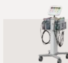
乾式ホットバック装置 認証番号：229AABZX00070000

少ない電流で大きな筋収縮が得られ、高齢者や慢性心不全の患者様でも筋疲労をきたしにくい低周波治療が行えます。通電による痛みや不快感を低減しているため、長時間の治療が可能となりました。