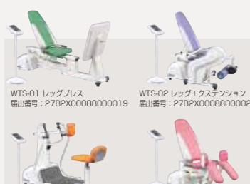
WTS-01 レッグプレス WTS-02 レッグエクステンション WTS-03 ローイング WTS-04 アブダクション 測定機能付自力運動制御装置

電位治療とは、数百～数万ボルトの交流や直流の高電位を体に加え、生体全体に影響を与える治療法です。低周波治療やマイクロ波治療のように体の一部分に働きかけるのではなく、全身に作用する全体療法です。