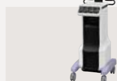
低周波治療器・干渉電流型低周波治療器組合せ理学療法機器 認証番号：231AABZX00012000