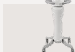
低周波治療器 認証番号：227AIBZX00003000