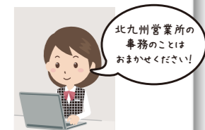
北九州営業所 ★ 事務職員

1991年4月生まれA型 鹿児島県出身 既婚・子2人 はまっている事：釣り、 釣り関係の道具のDIY