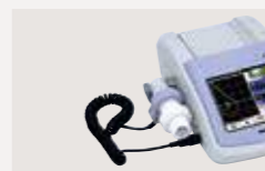
電子式診断用スパイロメータ 承認番号：21700BZX00256000