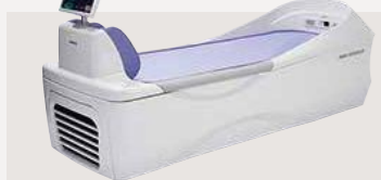
ベッド型マッサージ器 認証番号：229AABZX00048000