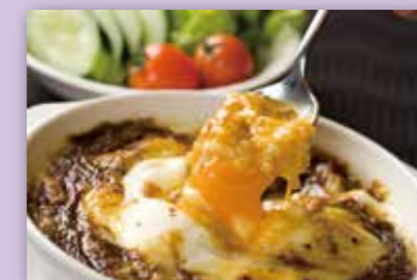
門司港発祥 焼きカレー