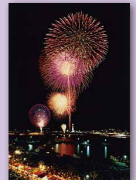
関門海峡花火大会