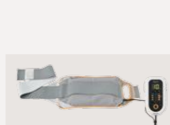
家庭用電気マッサージ器 認証番号：303AGBZX00038000

半導体レーザーの照射によって筋肉や関節の痛みをやわらげるレーザ治療器で痛みみの深部に浸透。腰痛、肩こり、関節炎やリウマチ、あるいはスポーツによる筋肉痛、腱鞘炎に効果を発揮します。