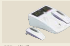
半導体レーザー治療器 承認番号：223008ZX00158000

超音波の機械的振動を生体に加え、その温熱作用とマイクロマッサージ作用による疼痛緩和や血流促進を目的とした超音波治療器です。通常、超音波治療では1MHzと3MHzの2種類の周波数を使用しますが、SZ-100は1台で両方の治療が可能です。