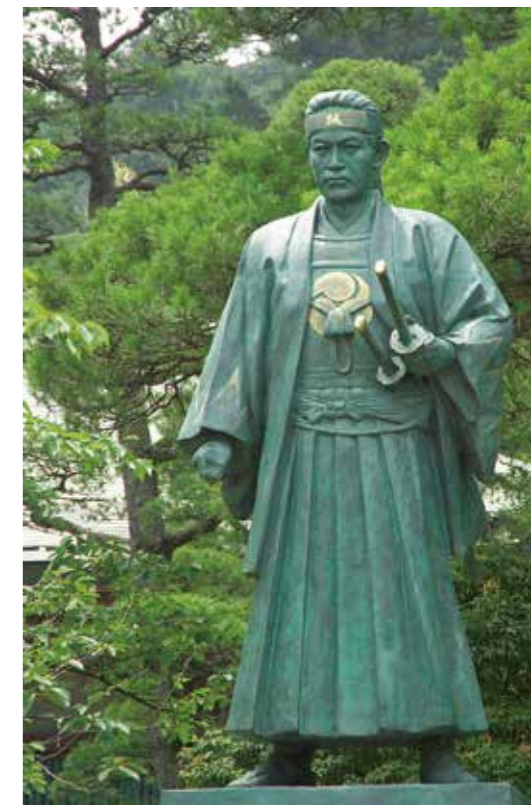
土方歳三像 高幡不動尊金剛寺 天保6年(1835年)~明治2年(1869年) 武州多摩郡日野宿石田村生まれ