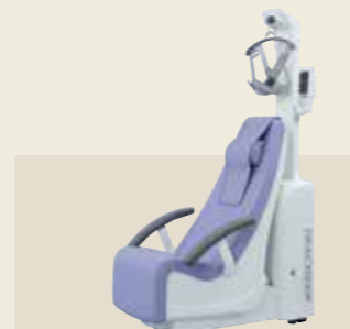
電動型自動間欠牽引装置 認証番号：226AABZX00076000

下肢からの刺激により、三次元的な脊柱の動きを誘発し、体幹のみならず上下肢関節周囲の筋緊張を連続的に軽減させます。