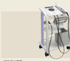
超音波治療器 認証番号：224AABZX00053000