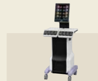
低周波治療器・干渉電流型低周波治療器組合せ理学療法機器 認証番号：231AABZX00011000

トラックタイザーTC-C1は、従来の頸椎牽引治療装置とは異なり、シートのチルト角度を制御することで最適な牽引ポジションを提供します。加えて、牽引ポジションの高い再現性が継続治療の効果を促します。