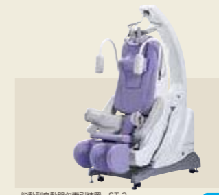
電動型自動間欠牽引装置 ST-3 認証番号：229AABZX00066000

下肢筋全般の筋肉を強化し、立ち上がる、座る、しゃがむ、歩く等の動作、日常生活に必要な筋力を強化します。足を固定しシートが可動する構造により、実際の動作により近い運動が行えます。