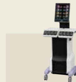
低周波治療器・干渉電流型低周波治療器組合せ理学療法機器 認証番号：231AABZX00011000

超音波の機械的振動を生体に与え、その温熱作用とマイクロマッサージ作用による疼痛緩和や血流促進を目的とした超音波治療器です。通常、超音波治療では1MHzと3MHzの2種類の周波数を使用しますが、SZ-100は1台で両方の治療が可能です。