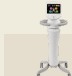
低周波治療器 認証番号：227AIBZX00003000

半導体レーザーの照射によって、筋肉や関節の痛みをやわらげるレーザー治療器。パワー密度が高い180mWの最高出力をピンポイントで照射し、素早く「痛み」の深部に浸透。腰痛、肩こり、関節炎やリウマチ、あるいはスポーツによる筋肉痛、腱鞘炎に効果を発揮します。優れた可搬性で、「いつでも、どこへでも」半導体レーザー治療を提供します。