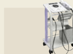
超音波治療器 認証番号：224AABZX00053000

ブーツ内部の片側5つの気室を加圧・除圧することで脚部をマッサージ。4種類のマッサージモードで症状に合わせた治療を行います。必要な時、必要な場所へ自由に移動できる優れた搬送性は、新しい治療スタイルを提案します。