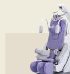
能動型自動間欠牽引装置 ST-3 認証番号：229AABZX00066000

少ない電流で大きな筋収縮が得られ、高齢者や慢性心不全の患者様でも筋疲労をきたしにくい低周波治療が行えます。通電による痛みや不快感を低減しているため、長時間の治療が可能となりました。