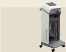
家庭用エアマッサージ器 認証番号：225AHBZX00021000

筋肉の柔軟性を向上させ、より効率的な治療を目指したメディカルモードを搭載。加えて、6つのノズルが強くやさしい刺激を生み出し、快適さを実現するマッサージマシンへと進化しました。進化したりラクゼーションの実現と治療感がここにあります。