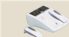
半導体レーザー治療器 承認番号：22300BZX00158000

高齢者の転倒事故を防ぎ、介護不要の自立した生活をサポートするために、身体機能の向上が求められています。そうした社会的要請に応じて設計・開発された高齢者のためのトレーニングマシン「ウェルトニックシリーズ」。レッグエクステンションは大腿四頭筋、特に内側広筋を強化します。運動することにより歩幅が広がり、膝が安定し、階段の上り下りもスムーズになります。