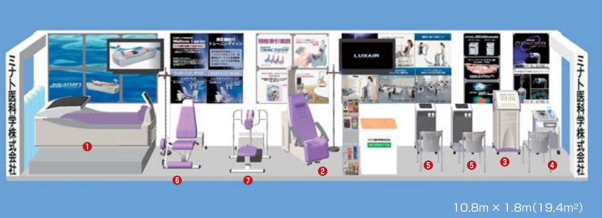
10.8m x 1.8m(19.4m 2 )