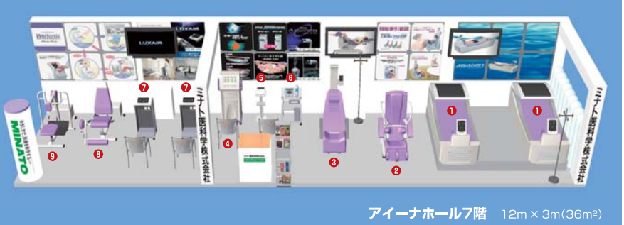
アイーナホール7階 12m x 3m(36m 2 )