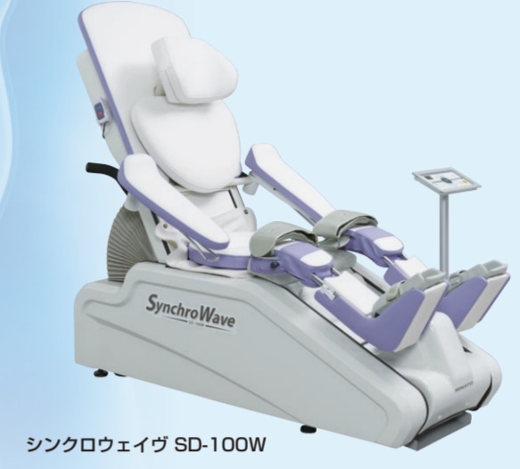
シンクロウェイヴ SD-100W