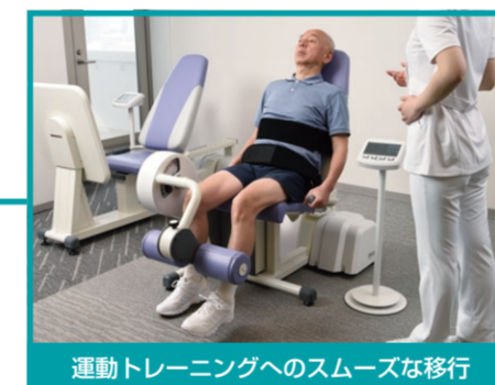
運動トレーニングへのスムーズな移行