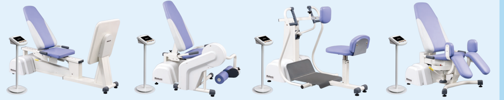
ウェルトニック WTS-01 (レッグプレス) 届出番号 27B2X00088000019 一般医療機器 / 特定保守管理医療機器