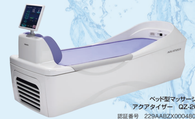
ベッド型マッサージ器 アクアタイザー QZ-260 認証番号 229AABZX00048000 管理医療機器 / 特定保守管理医療機器