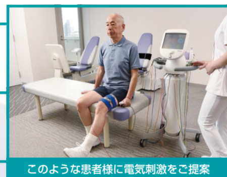
このような患者様に電気刺激をご提案