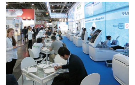
常時、試乗者が行列を為すミナト医科学ブース